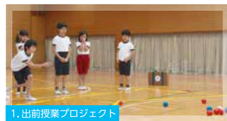
1. 出前授業プロジェクト