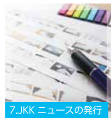
7. JKK ニュースの発行