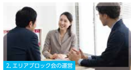
2. エリアブロック会の運営