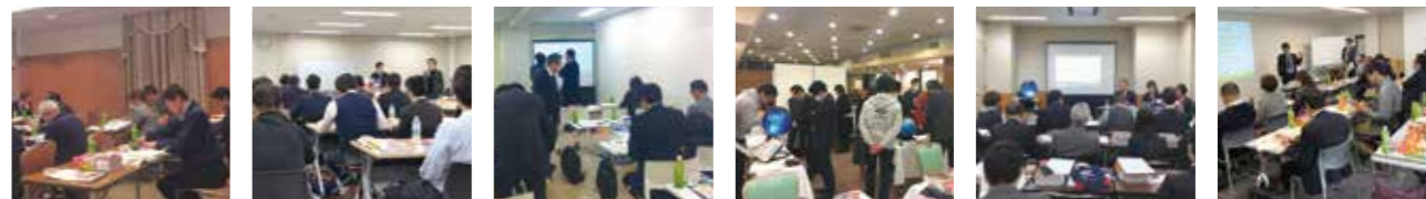
中国・四国ブロック会 2019年3月2日(土) | 関東ブロック会 2019年2月23日(土) | 九州・沖縄ブロック会 2019年2月16日(土) | 東北ブロック会 2019年2月16日(土) | 近畿ブロック会 2019年2月9日(土) | 中部ブロック会 2019年2月9日(土)

勉強会では教材・教具カタログ「スクラボ」のおすすめ商品のご説明、並びに特別支援カタログの活用先としての販売事例、防災用品の販売事例をご紹介させていただきました。またJKK組合員が独占販売できる商品として、2020東京オリンピック・パラリンピックのマスケットである「ミライトワ」「ソメイティ」のぬいぐるみ販売のご説明。さらに教科横断型の教材として、主体的・対話的な学びにつながる小型インタラクティブ地球儀「SPHERE」(スフィア)を使ったデモ授業をし、「営業同行は可能か?」「デモ機はあるのか?」等々、販売に向けての積極的な意見交換がされ、有意義なブロック会、カタログ勉強会となりました。引き続き、皆様のご意見を参考に、より良い製品・カタログ作りに取り組んで参ります。 ご参加いただいた組合員の皆様、ありがとうございました。