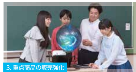
3. 重点商品の販売強化