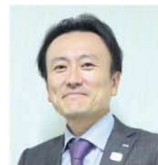
日本のものづくりを通じて、学校教材や保健室用品などの企画・開発、流通を担う（株）三和製作所の代表取締役社長。