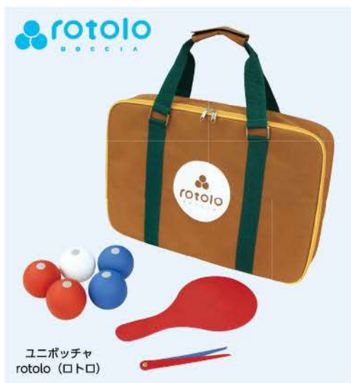
ユニポッチャ rotolo (ロトロ)

最後になりますが、本年は様々な社会環境の変化により、まさに大きな変革を迫られる年になるうかと存じます。その中でも当組合は、学校教育における先生方の最大のサポーターとしてお力になれるよう精進してまいります。 本年もどうぞ引き続きよろしくお願ひ申し上げます。