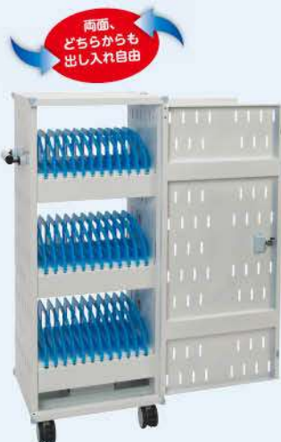
両面扉式 タブレットPC 充電保管庫 アイリス [IRIS-39]

貴重な授業時間を少しでも長く確保できるように、児童・生徒がタブレット・PCを両側から出し入れでき、スムーズな準備や片付けができるように配慮された、新しいスタイルの保管庫。省スペース設計で教室内に置きやすく、簡単設定の輪番充電も便利です。