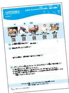
児童/生徒用のワークシート

今回も映像教材に加え、指導案と児童/生徒用のワークシートをご用意いたしました。15分の短い時間ではありますが、「できない(I'mpossible)」を「できる(I'mpossible)」に変える「小さな工夫」はこの教材にもたくさん詰まっています。この授業でパラリンピックに興味をお持ちいただき、「I'mPOSSIBLE本編への学びへも繋げていただけましたら幸いです。